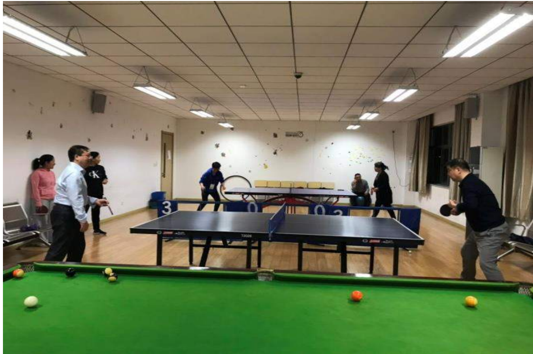
学员们利用课余时间学院教职工活动室打乒乓